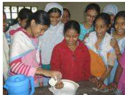
Foto van de les over handen wassen