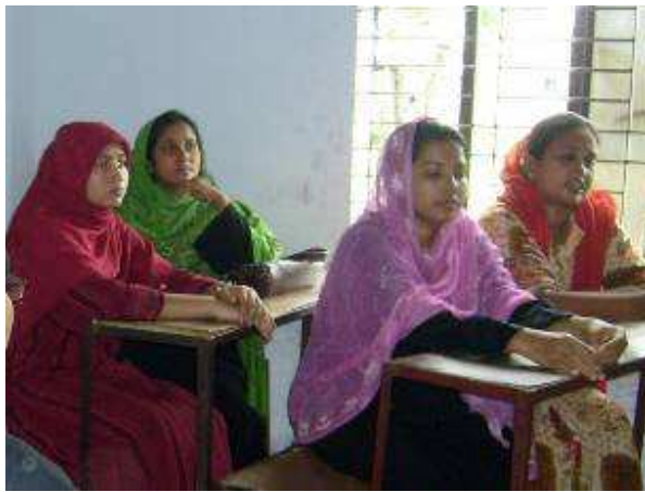
Foto: docentmiddag Latifunessa school